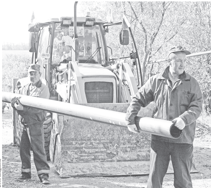
Города и села в Лутугинском районе ЛНР заметно преобразились не без шефской помощи Ульяновской области.

- В течение девяти лет у нас не было возможности массово убирать аварийные деревья - с вашими ребятами сде-