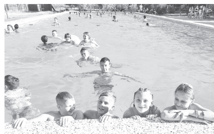
Стало доброй традицией летние каникулы проводить в Ульяновске.